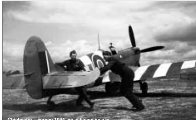
Chichester – červen 1944, po zahájení invaze