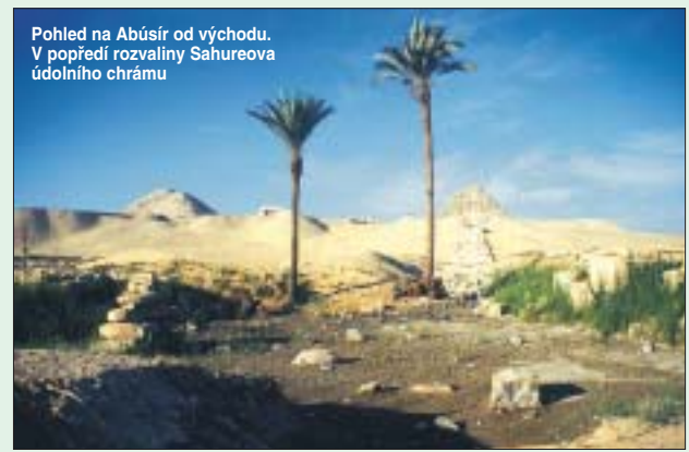
Pohled na Abúsír od východu. V popředí rozvaliny Sahureova úrodného chrámu