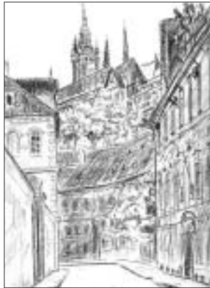
Kresba L. Štohr

19. st. Letohrádek Hvězda – celk. prohlídka