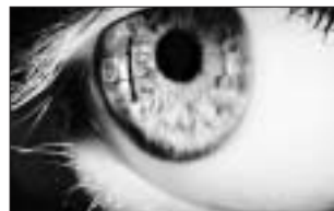
cykly a neorganizovaným zátěším. Zlomek této tvorby bude na zmíněné výstavě také prezentován. Maf