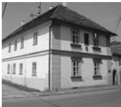
Rodný dům A. Dvořáka v Nelahozevsi.

muzeum másla, kde najdete všechno, co se při domácí výrobě másla používalo – máselnice, tvořítka, máslenky k servírování, krajáče, obaly atd. A ještě k tomu uslyšíte zasvěcený výklad! Mimo stálé expozice pořádá obec v předsálí muzea různé tematické výstavy a v muzejním krámku si můžete koupit něco na památku, přičemž hlavní inspirací je kráva, co mléko dává. V roce 2003 otevřela obec naučnou stezku, která vede chráněným územím Máslovické stráně k Vltavě.