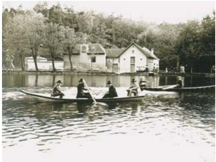
Rybník u mlýna v Kunraticích (neznámý autor, kolem 1908). Oba snímky z archivu historika fotografie P. Scheufflera.

Staropražské léto často nebyvalo příliš příjemné, kola povozů vířila ve vysušených ulicích prach, a protože se v Praze řádná kanalizace teprve budovala, podél chodníků na mnoha místech zahňával kal. Pro obyčejné Pražany bylo uvnitř města málo zeleně, protože sady patřily k palácům či klášterům a nebyly veřejně přístupné. Naštěstí se ale v létě na mnoha místech otvíraly zahradní