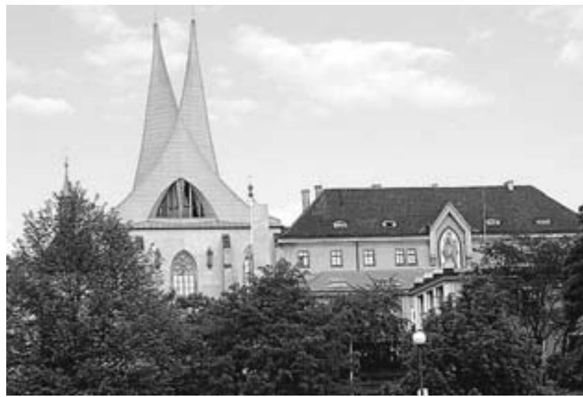
Emauzský klášter na Slovanech

■ Vojanovy sady z botanického hlediska. Začátek ve 14.00 před vstupem do zahrady z ul. U lužického semináře na Malé Straně. (Ing. V. Válová)