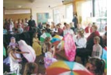
Dětský den v rezidenci Classis.

Protože se v Čechách doposud jedná o ojedinělou koncepci seniorského bydlení