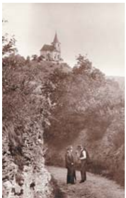
Šárka, pod kostelem sv. Matěje (J. Eckert, kolem 1885).