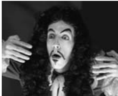
Molière – komedie Lékařem proti své vůli

6. 8. / 19.30 / Státní opera Praha Molière komedie Lékařem proti své vůli La Fabrique à théâtre – divadelní společnost (Francie) Jean-Denis Monory – režie s českými titulky