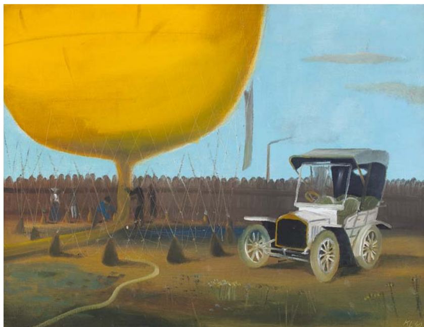
K. Lhoták, Soupeři, 1940, olej na plátně, soukromá sbírka

kdo malíře znali, milovali jeho dobrosrdečnost a velký smysl pro humor. Přesto z jeho díla ponejvíč dýchá nostalgie a touha „nalézt duši místa“. Zkuste zastavit se před obrazem pusté písečné pláže kdesi ve Francii a přemýšlet, co skrývá bílý stan na pobřeží. Nic dalšího už na obraze není, ale to stačí. Jen modré moře, modrošedé nebe a ten – možná prázdňový – stan. Přesto se od plátna nelze odtrhnout.