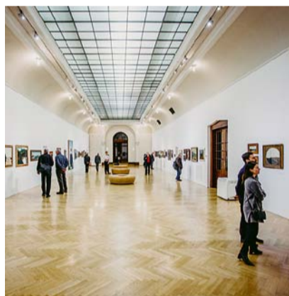
Pohled do expozice.

s výškovými domy. Zde je však příměstská krajina volná a klene se nad ní modré a čisté nebe. Stojí tu dřevěné boudy, o kterých není nutno vědět, proč tu jsou, ale zato lze pozorovat přípravy na start balonu. Z Lhotákových maleb vždy silně vyzařuje klid, zároveň jsou však často paradoxně zaplněné rychlými stroji – auty, letadly či závodními bicykly. Kontrast pomalu plynoucího času na městské periferii v nedělním odpolední se zálibou v rychlých strojích je tím, co nás k obrazům upoutá.