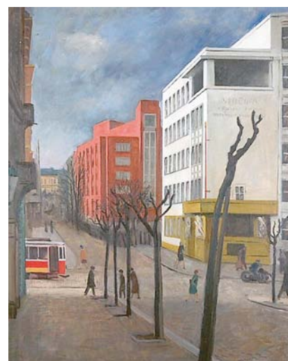
Rudolf Vejrnych, Škola, kolem 1930 , Galerie hlavního města Prahy