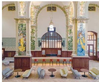
Praha hlavní nádraží, Sloupový sál

Letos se poprvé do programu festivalu připojí i několik budov v rámci areálu Pražského hradu. Navštívit bude možné například Prezidentskou rezidenci, již původně navrhl architekt Pavel Janák pro Edvarda Beneše. Otevře se i další mimořádný objekt v Královské zahradě – Nová oranžerie od Evy Jiřičné, patronky festivalu. Poslední otevřenou budovou pak bude Lobkovický palác, který je jedinou soukromě vlastněnou částí Pražského hradu.