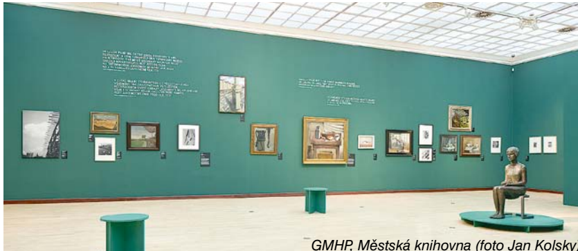
GMHP, Městská knihovna

Proto se náměty nového realismu často stávají nejen kavárny, kterým je tu věnována velká plocha v podání vícero umělců, ale také fabriky, dílny, ulice, domácnosti chudých. Portréty bankéřů, ale i žebráků, hrající si děti, nádražní hala plná cestujících, vagon s dělníky, jedoucími na šichtu. Výstava vypovídá o době, v demokratickém prostředí nového Československa let 20.–40., ve které tehdejší umělci tvořili zcela svobodně, z vlastní vůle, bez politické objednávky či nátlaku. O jejich sociálním citění, obdivu i obavách z průmyslového rozvoje společnosti a potřebě pravdivého uměleckého vyjádření tedy nelze pochybovat a je třeba je číst.