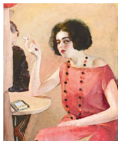
Oldřich Homoláč, Dívka v červeném, 1927 , soukromá sbírka