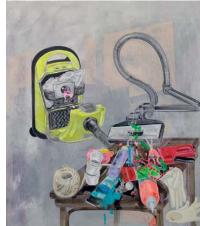
Polykač barvy, akryl na plátně, 150 x 160 cm, 2010

K jejímu obsahu autorka říká: „Strača každý den usedá na pavlačí a systematicky se nasnídá psích granulí. Umí si posunout víko barelu a zas ho zastrčit. Poukládala jsem na poličky množství polotovarů do asambláží a jednoho rána jsem zjistila, že barel s granulími ji přestal zajímat a veškerá pozornost je soustředěna na blyskavé spirály, koule, útržky předmětů a jiné fascinující objekty. Začala jimi postupně pohybovat, přenášet, upouštět na podlahu, až ukradla řetězky. Když ji pozorují, představují si objekty, které vytváří z uloupených kořistí. Je úporná, přirozená, systematická a krásná. Stala se frontmankou mojí nové výstavy. Objekty a obrazy, které skládám úmyslně i náhodně, hnízda které pletu, jejich skladba, čirá radost z možnosti to dělat, má mnohé společné se stračí náтурой. Nanáším barvy, předměty, dráty. Co objevím, to vezmu, přilepím, přivařím, připletu. Co se mi líbí, to si namaluji. Neřeším, či to bude návazné s tím co bylo nebo bude. Miluji rychlou jízdu, občas vystrčím hlavu, dostanu prudkou ránu vzduchem a smítko do oka. Pohybují se jednou dopředu, jednou dozadu, hlavně se nezastavovat.“