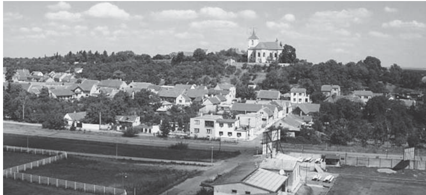
Pohled na Sadskou (Vycházka Sadská – město při Labi a na okraji lesů. – 17. 7.)

➤ Pražská mobilní zvonohra. Výklad o historii a výrobě zvonohry s krátkou ukázkou hry na tento nástroj za účasti autora s vystoupením několika předních evropských carillonů. Součástí bude prohlídka znovuzrozené historické usedlosti Ladronka. Začátek