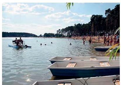
Lhotka písečné jezero

Krásné koupání, méně lidí a dobré zázemí je i na dalších pískovnách v okolí – Proboštských jezerech, Ovčárech nebo na bývalé pískovně Malvíny u Čelákovic (zde už zázemí chybí, zato je zde čistíčkou filtrovaná voda). Podobné koupání najdete i na jih od Prahy v bývalém kamenolomu Hřímědici (50 km z centra Prahy) – bez záze-