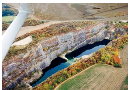
Lom Amerika – letecký pohled

ním a opalováním, abychom nakonec netlivali?