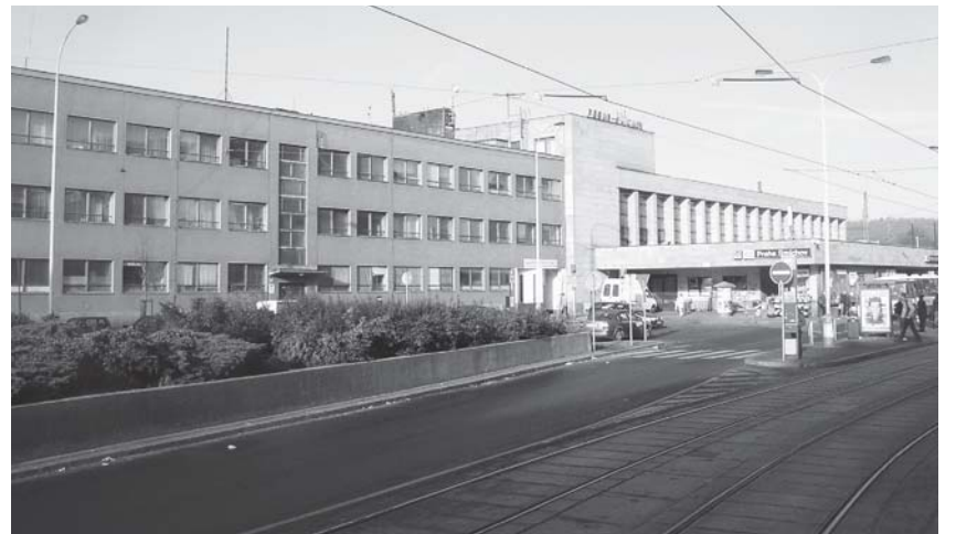
Smíchovské nádraží (Vycházka 14. 7. Smíchovské nádraží)