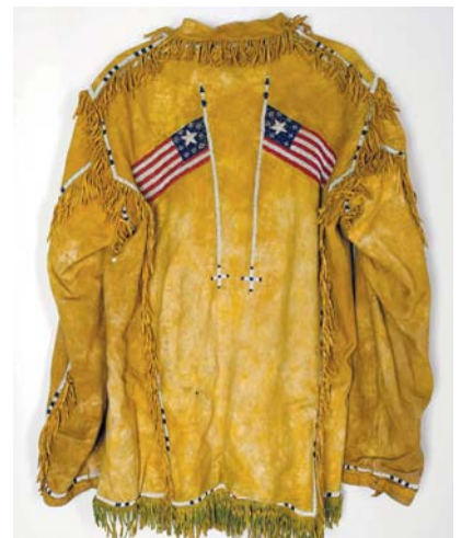
Košile, Dakota, USA, okolo 1990

kde jsou kladeny protiklady mezi „civilizovanou“ a „primitivní“ společností či mezi industriálním technologickým světem a rurálním nebo „tradičním“ světem.