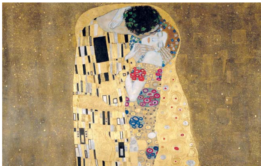
Polibek (olej na plátně, 1907–1908)

Dozvídáme se tak nejen o jeho výsadním postavení ve vídeňské společnosti a vlivu na další umělce (Egon Schiele, jemuž byl jakýmsi mentorem), ale i o údělu věčného boje s vkusem a názory starších generací (to na počátku období, kdy se Klimtův styl osvořil od historismu), až po tragický osud tří Klimtových monumentálních obrazů Lékařství, Filosofie a Právnictví, které nejprve skládily odpor, takže umělec na protest zrušil obrovsky lukrativní zakázku a vrátil za ni peníze. Hotové obrazy se dostaly na jiná místa, než byly určeny. Za války byly odvezeny z Vídně, již hrozilo bombardování, ale nešťastnému osudu unikly, protože zá-