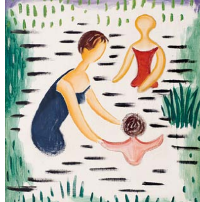
Josef Čapek, Koupání v Oravě

Nadmíru kvalitně je reprezentována česká moderna těmi nejznámějšími autory a též díly, která neměla veřejnost dosud možnost spatřit. Jedním z nich je velkoformátová kompozice, která zastupuje nefigurativní polohu umění od F. Foltýna. Ve Francii vznikl konvolut kreseb od F. Kupky, které se staly přípravnými pracemi ke slavným