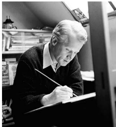
© Jiří Šlitr v ateliéru kreslí, foto I. English

Jiří Šlitr maloval od mládí. Svěbytný styl vytváří ale teprve od roku 1958, kdy měl možnost seznámit se s moderním západním uměním během světové výstavy EXPO Brusel, na níž zářil i jeho talent. Uměním a komikem. A protože Šlitrovým prostředím bylo město a v něm lidé, množství jeho kreseb zaznamenává atmosféru kaváren a barů, ulic i náměstí. Vznikají originální črty z pracovních cest s Laternou magikou nebo Semaforem do světa – ty nejzajímavější z New Yorku. Většinou nenesou žádné