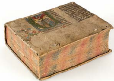
Vazba knihy Deductio , s ukázkou pergamenových desek, 1620

Až do 15. století bylo písařské řemeslo vysoce ceněnou činností a provozovalo se především v klášterech. Vzdělaní duchovní pracovali ve skriptoriích, kde knihy nejen opisovali a přepisovali, ale další také iluminovali a vázali. Jejich jména často vůbec neznáme. Písařské řemeslo se později rozšířilo i mimo duchovní okruh, na panovnícké a šlechtické dvory, univerzity. Působili i písaři vojenští, veřejní a městští. V této části výstavy je k vidění asi nejzářnější exponát, faksimile listiny na pergameni císaře Fridricha III. z roku 1473.