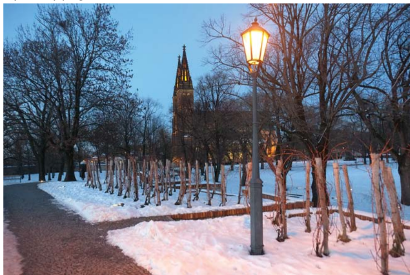
Vyšehrad (vycházka 22. 12.)

Vycházky se konají s maximálním počtem 50 účastníků ve skupině, přednost mají účastníci se zakoupenou vstupenkou. VYCHÁZKY OZNAČENÉ HVĚZDÍČKOU* MAJÍ OMEZENÝ POČET ÚČASTNÍKŮ, DOPORUČUJEME VYUŽÍT PŘEDPRODEJE v turistických informačních centrech, v recepci Arbesovo nám. 4, pouze po-čt nebo on-line na http://eshop.prague.eu .