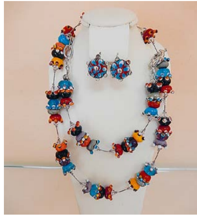
Souprava z českých vintných perli