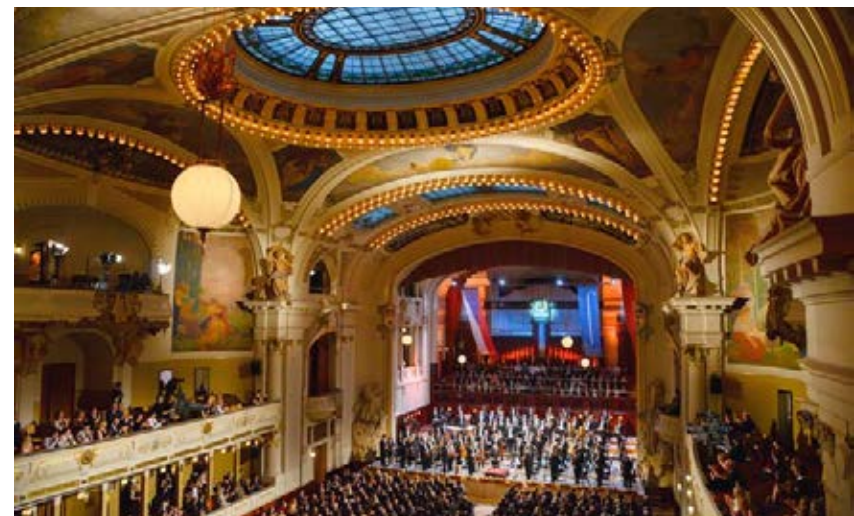
Zahajovací koncert: D. Barenboim, Wiener Philharmoniker (12. 5. 2017)

Jeden z nejstarších a nejprestižnějších hudebních festivalů v Evropě, Pražské jaro, poprvé od svého vzniku v roce 1946 prožívá zásah vyšší moci. Dlouho a složitě předem vyjednávané koncerty zahraničních orchestrů a světových sólistů se nemožno uskutečnit. Organizátoři ale před pandemií nekapitulovali a rozhodli se letošní speciální ročník přesto uskutečnit v podobě 11 koncertů, které budou živě přenášeny z pódii pěti pražských koncertních sálů a jedné brněnské.