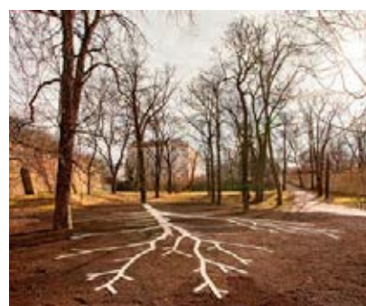
Pomník Maxe van der Stoela, Dominik Lang, Jakub Červenka a kol., foto © Pavel Matela

V úvodu výstava nabízí přehled zdokumentovaných míst podle městských částí. Stačí si jen vybrat, co nás konkrétně zajímá. Ještě jste nebyli na Bastionu u Božích muk (Praha 3)? Neznáte to v Parku Podvíní (Praha 9)? Zajímá vás, jak si architekti poradili s řešením velkých staveb z pohledu začlenění do městské krajiny a úpravou ploch kolem nich? V přehledu najdeme řešení Anděl City nebo centrály ČSOB (Praha 5). Jsou tu i zajímavé tipy na malý výlet za Pra-