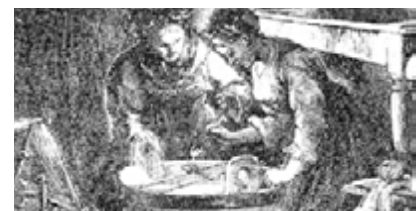
Lití oliva přes klíč do studené vody při věštění budoucnosti