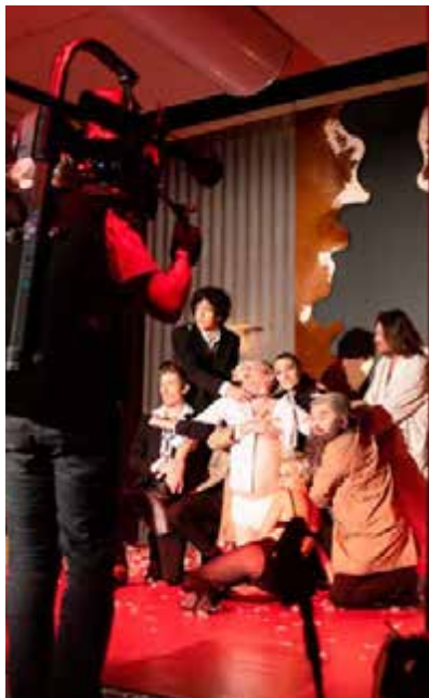
Divadlo Na zábradlí Macbeth Too

S přenosem živých představení začali v Jitkách78 na svých facebookových stránkách už při jarní vlně pandemie. Ze sledovanosti, která se dostala na 150 tisíc diváků, usoudili, že divácký zájem a potenciál tu je. Svědčí o něm i první dny vysílání Televize Naživo, se přibývajícími programy se očekává ještě výrazný nárůst. Kdo by televizní kanál nemohl naladit na svém televizním přijímači, může program sledovat tak jako