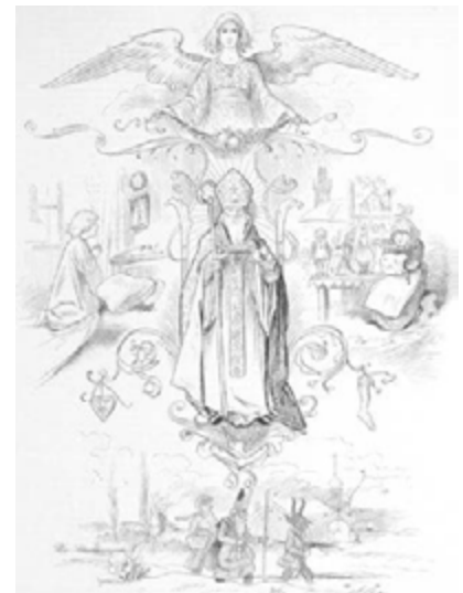
Průvod na svatého Mikuláše se zřetelně vyobrazenými maskami (wikipedia.org)