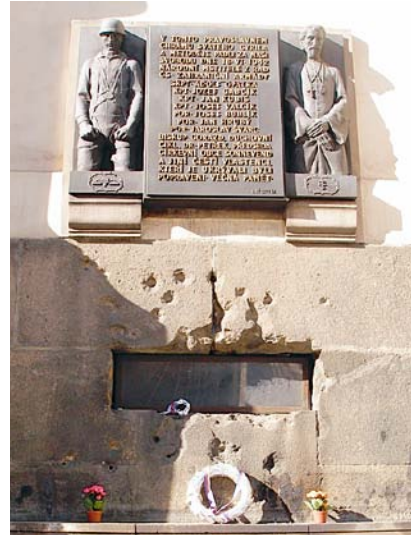
Památník parašutistům a duchovním, kteří zde v roce 1942 zahynuli, je umístěn na vnější straně kostela z ulice Resselova.

Kostel v Resselově ulici nesl v době války jméno Karla Boromejského, slovanským věrozvěstům je zasvěcen až od roku 1935. V devatenáctém století měl být dokonce zbourán. Pak ale na veřejnost pronikla fake news, která tvrdila, že kostel je dílem architekta Kyliána Ignáce Dientzenhofera. Dílo takového veličana přeci jen nejde jen tak zbourat ani o bourání rozhodnout jedním škrtem pera, proto se demolice zdržela a začalo se o budově diskutovat. Než se přišlo na omyl, protože slavný architekt sice na kostele pracoval, ale jen na dokončovacích pracích, došly peníze a bourání se nekonalo.