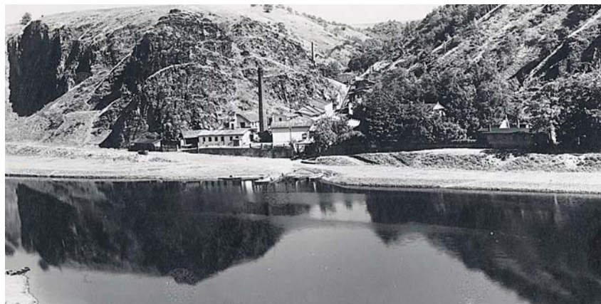
Pohled na dům čp. 50 (dynamitka) ve vltavském údolí v Bohnicích – z levého břehu Vltavy se skály u roztokého lesa.

V roce 1867 pracovitěho švédského chemika Alfreda Nobela čekal jeho největší úspěch – vynalezl dynamit. Nová výbušnina byla šestkrát účinnější než střelný prach, patentoval ji v mnoha zemích. Využití dynamitu skýtalo obrovské možnosti rozvoje průmyslu a stavebnictví.