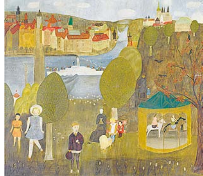
Praha od Ládví, 1962

vzniku autorka vyprávěla i v pořadu Českého rozhlasu: „Nějsou to ani knížky, spíš takové sešitky, odreagovala jsem se tím od života.“ V sedmdesátých letech tak vznikly její Horror pro školní družiny a Krvavé MDŽ. A později Politicko-eroticke sny čtenářky Lidových novin nebo hra se zpěvy Od svítání do svítání neboli Srdce žije z naděje, a ne přítomnosti chudou nebo další s názvem Viděl jsi černošky?