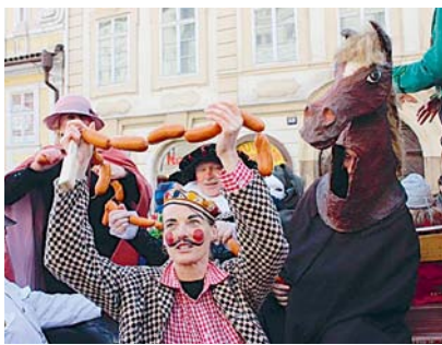
Malostranský masopust

Masopust, jinak též ostatky, fašank nebo v širším smyslu karneval, je doba, která byla kdysi „svátkem“ hodování a zábavy spojené s koncem zimy. Během masopustu se konaly zabláčky, tancovačky a obcemi i městy procházely průvody masek. Poté následoval čtyřicetidenní půst.