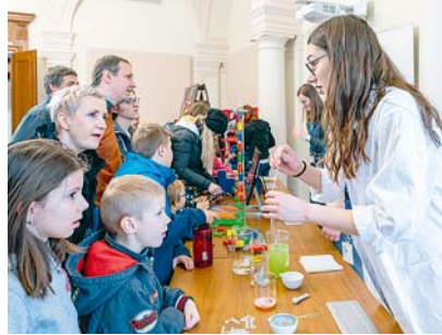
Týden mozku