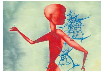
Gobelín Nahý v trní I. podle předlohy Mikuláše Medka (detail)

Každý návštěvník této ojedinělé výstavy si může najít jiné „své“ dílo, které k němu nejvíc promlouvá. Mohou to být Sopkův