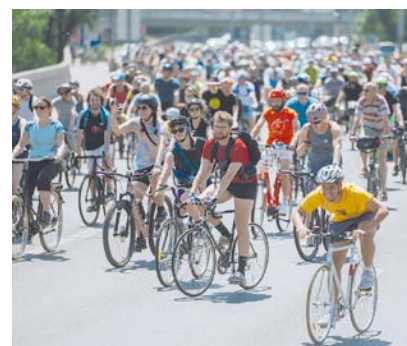
Cyklojízda Praha

téměř 25 000 lidí z celé republiky a překonal tak všechny dosavadní rekordy. Organizátoři doufají, že letos se přidá ještě více těch, kteří se budou po celý měsíc připravovat z a do práce převážně na vlastní pohn. K včasné registraci vybízí i progresivně rostoucí startovní, to znamená, čím dříve se přihlásíte, tím levněji vás vyjde startovní balíček s ročníkovým tričkem z biobalviny v originálním designu.