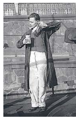
Foglar natírá zábradlí na lodi skaut, 1935