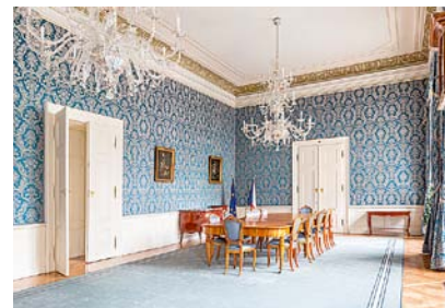
Nostický palác

Další novinkou je Nová scéna Národního divadla , brutalistická budova s charakteristickými skleněnými tvarovkami, která bude zpřístupněna u příležitosti 100. výročí narození architekta Karla Pragera a také 40. výročí jejího otevření. Lidé budou moci navštívit hlediště s jevištěm, zálukisí, projekční kabinu, maskérnu či kostýměrnu. V neděli 21. května od 11.00 hodin se zde uskuteční také prohlídka pro děti s pracovními listy pro malé architektky. Ve středu 17. května od 12.00 hodin v rámci doprovodného progra-