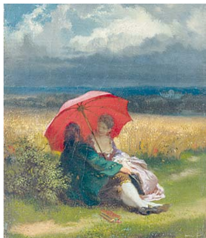
Josef Mánes, V létě (Červené parapličko), 1855, soukromá sbírka