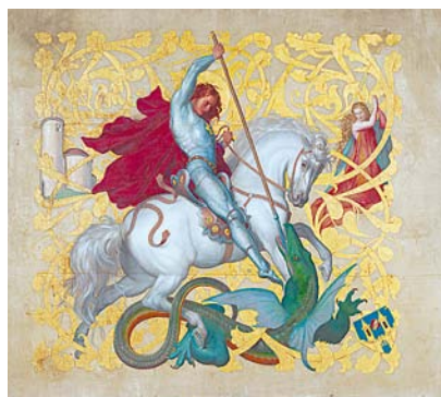
Josef Mánes, Prapor zpěvákůvého spolku Říp v Roudnici nad Labem, 1863–1864