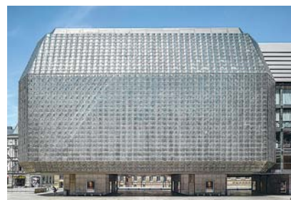
Nová scéna

mu proběhne také prohlídka pro děti, na kterou naváže workshop divadelní techniky. Na tuto prohlídku bude nezbytná registrace.