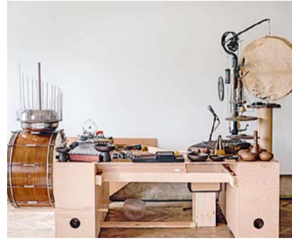
Světloplach, Petr Nikl

Výstava Petra Nikla, doprovázená fotografiemi a zvukovým dialogem, reflektuje jedinečný charakter SmetanaQ Gallery na pražském nábřeží.