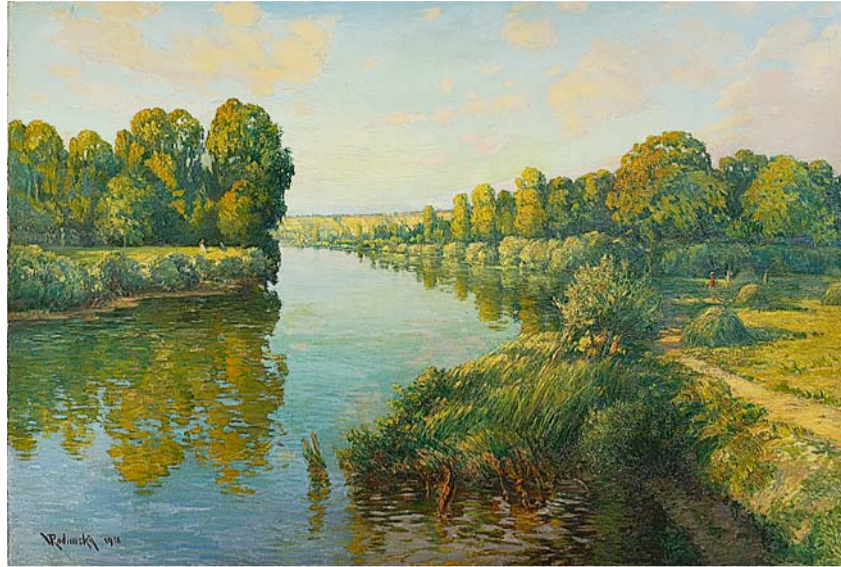
Labská krajina, olej na plátně (ČS, pobočka Kolín)

Václav Radimský (1867–1946), pocházel ze staré mlynářské rodiny, které patřil mlýn v Kolíně Zálábí. Byl klukem od vody a řeky ho provázely celý jeho život. Na začátku Labe, pak ve Francii Seina a po návratu do Čech opět Labe.