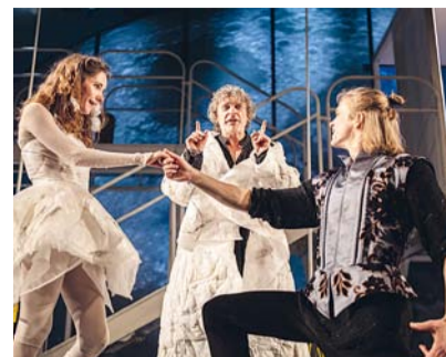
Bouře