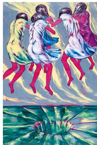
Levitace, olej na plátně

Pláče , to je soubor hned několika portrétů plačících mimin, kterými představuje svou fascinaci animálností, dřímající v každém dítěti, skrze kterou je schopné předat obnaženou lidskou emoci. Sám