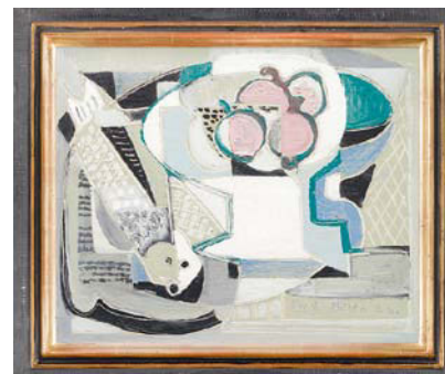
Emil Filla, Zátěš s ovocem a rybou, 1928