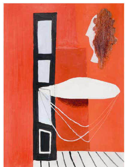
Alois Wachsmann, Ludvík XVI., 1932

Datum konání aukce: 12. listopadu 2023 od 16.00. Datum konání předaukční výstavy: 21. října – 11. listopadu od 10.00 do 18.00 12. listopadu od 10.00 do 15.30 (otevířeno denně včetně víkendů a svátků) Místo: Výstavní síň Expo 58 ART, Letenská sady 1500/80, Praha 7 Více informací a aukční katalog naleznete na www.aloos.cz . –PR–