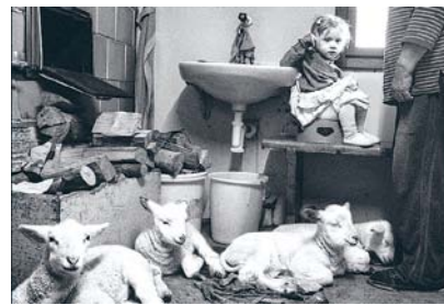
© Josef Vrázel, Velké Karlovice, 2023

Josef Vrázel se fotografování věnoval už na základní a střední škole, zpočátku zejména tématu valašské krajiny, s nímž dosáhl prvních úspěchů. Často fotografoval