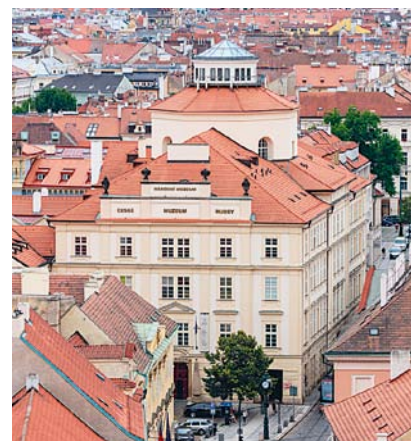
České muzeum hudby v Karmelitánské ulici.

la například také ve Vídni, na německých, polských i francouzských scénách. V Pražském Divadle pod Palmovkou se letos už objevila i její svěrázná činoherní verze se zpěvy. Smetanově osobnosti se určitě budeme věnovat i v březnových Listech Prahy 1, proto zde jen dodatek: Snad všechny české operní scény chystají k letošnímu 200. výročí narození – a také 140. výročí úmrtí (zemřel 12. 5. 1884) něco mimořádného. V Praze se kromě řady menších i větších projektů přesně na výročí narození 2. března chystá velký koncert ve Smetanově síni Obecního domu. Na pozvání pražského pěveckého sboru Smetana zde vystoupí 200členný pěvecký sbor složený