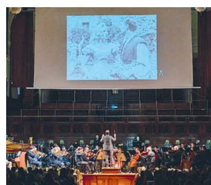
Česká filmová hudba v podání FOK.