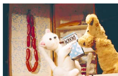
25. 2. / 16:00 – Fousatý případ Valeriána Draka.

Činoherní detektivní pohádka, ve které se věhlasný detektiv Valerián Drak vydává po stopě strašlivého lupiče Šestiprstáka. Vyšetřování nebude tak jednoduché, jak se na první pohled zdá. Čím dál zamotanější zápletky zamotávají hlavu všem. Místem činu zločinu je Staré Město pražské, není tedy až tak překvapivé, když do příběhu vstoupí tajemné síly, na které jsou i moderní vyšetřovací metody krátké. Délka představení je 60 minut. Pro děti od 6 let.