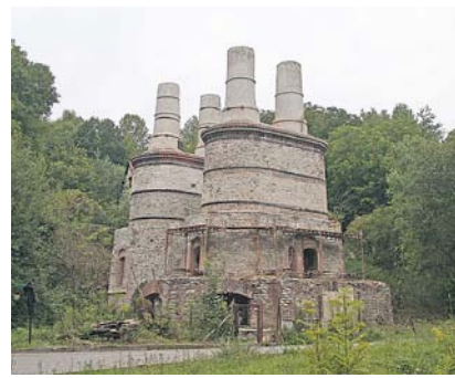
Vápenka ve Velké Chuchli

val o její demolici kvůli nedostatku prostředků na údržbu.