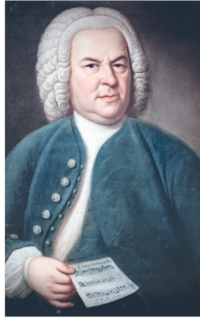
Johann Sebastian Bach v r. 1748 na portrétu Eliase Gottloba Haussmanna

Jak je to v případě autorské tvorby, kdy žádná původní inscenace neexistuje? „K poznání podoby tanců nám slouží dobové manuály, kde jsou v ideálním případě zapsány v Beauchamp-Feuilletově notaci. Jak dvorské tance, tak historii