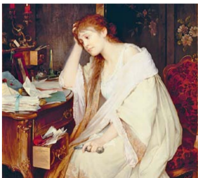
Luisa Max-Ehler, Telegram, 1894, NGP

Nastupující renesance poskytla ženám více volnosti a úcty, čehož mnohé z nich dokázaly využít i při uplatnění svých talentů. Příkladem jsou tu díla čtyř výrazných umělkyní renesančního malířství na Apeninském poloostrově. Najdeme tu několik pláten asi nejznámější malířky té doby, jménem Sofonisba Anguissola z Cremony. Obdivujeme virtuozitu její malby, podobně i u Elisabetty Sirani (obraz Kristus – Ecce homo, kolem 1663). Dozvíme se ve zkratce i osobní příběhy umělkyní; například Lavinia Fontana byla první ženou, která provozovala vlastní atelier. Dočteme se o uznání, kterého se jim již v době jejich života dostalo, ale i o méně radostných chvílích. Doslova martyriem si prošla Artemisia Gentileschi, jejíž oslnivý talent obohatil barokní malířství, a již se dostalo jak uměleckého uznání, tak i jistého zadostiučinění. Avšak její plátno David vítězí nad Goliášem diváka doslova uhrane.