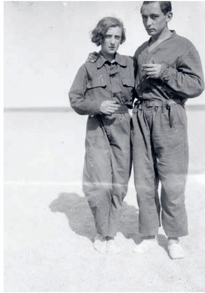
Anna-Eva Bergman a Hans Hartung

On maluje ji, ona fotí jeho – a naopak: Hans a Anna-Eva se celý život vzájemně objevovali. A to i tím, že se navzájem portrétovali, zachycovali v nejrůznějších okamžicích a etapách jejich soužití. Sledujeme tu dlouhou sérii vybraných snímků, kreseb i maleb různými styly a technikami jich obou. Je z nich patrný posun v čase, ale i vzájemná láska, hravost i úcta jednoho k druhému. Zejména Hans fotí všechno a všude, je „archivářem“ života. Oba pak spolu fotí kameny – a vznikají úchvatné snímky, u některých nevíme, kdo z nich dvou je autorem.