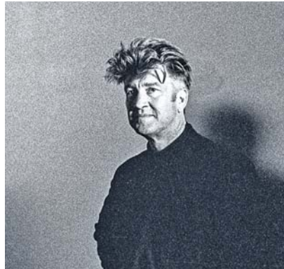
David Lynch v Praze 1996