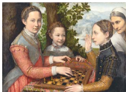
Sofonisba Anguissola, Šachová hra, 1555, Museum Poznaň

Výstava začíná tématem církevního umění, vznikajícího ve středověkých kláštřích, kde se ženy mohly v tomto oboru uplatnit nejdříve. Umělecká díla v podobě deskových maleb, iluminovaných rukopisů i předmětů užitého umění vznikala pro ženské řády, tudíž byla ženami jak iniciovaná, tak často i vytvářena, přestože nelze ještě vždy doložit. Uplatnilo se zejména umění vyšivky různých liturgických textilií. Nejstarším exponátem výstavy je tzv. antependium z chebského kláštera klarisek (kolem roku 1300), impozantní výšivka zobrazující řadu světců s převahou žen i Madonu s Ježíškem.