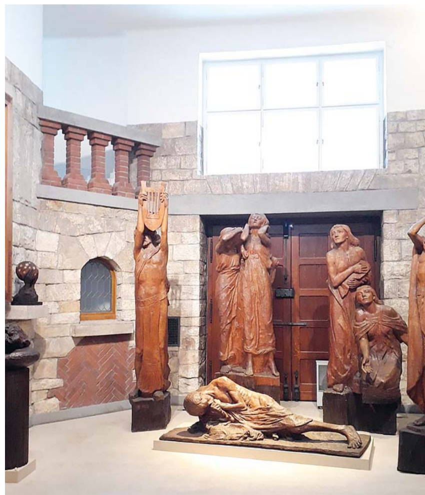
Bílkova vila interiér, vycházka 19. 10. (zdroj: Mapy.com, foto Saly Losová)

Dvoudenní slosovateľná a přenosná vstupenka platí na veletrh a také do Galerie a muzea Vysočiny v Havlíčkově Brodě a můžete na ni vyhrát knihy a jiné zajímavé ceny. Vstupenka bude stát 90 Kč a bude možné si ji koupit přímo u pokladny veletrhu nebo předem elektronicky na stránkách Kulturního domu Ostrov. www.hejkal.cz