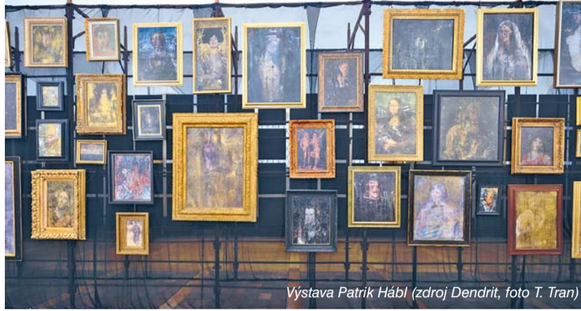
Výstava Patrik Hábl

Čas je pojem, který Hábla stále láká a fascinuje. Vyjádřením toho je i jednoduchá instalace obrazů, visících na poloprůsvitném černém textilním materiálu, nataženém přes lešení. A obejdeme-li je na druhou stranu, můžeme na sebe nechat působit další sérii portrétů – tentokrát od počátku originálních a bez rámu. Jde o tváře více než stovky předčasně zemřelých. Umělců, vědců a dalších osobností, které měly ještě co říct