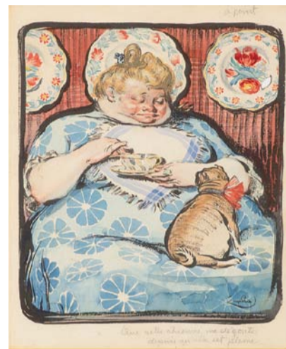
KUPKA FRANTIŠEK, Žena se psíkem, kvas na papíře, 35 x 30 cm, vyvolávací cena 980.000 Kč

Přesto však naše nabídka není určena jen velkým investorům – snažíme se, aby si v ní našel své místo opravdu každý. Proto pravidelně zařazujeme i umělecká díla v dostupnějších cenových hladinách, která otvírají dveře do světa sběratelství i začátečnickům.