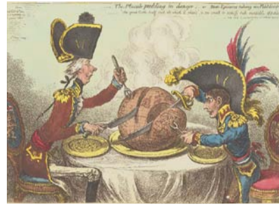
James Gillray, Švestkový pudink v ohrožení, 1805, Národní galerie v Praze

Návštěvníci výstavy budou moci shlédnout díla od Václava Hollara (1607–1677, český barokní rytec a kreslíř), Jamese Gillraye (1756–1815, anglický malíř a grafik,