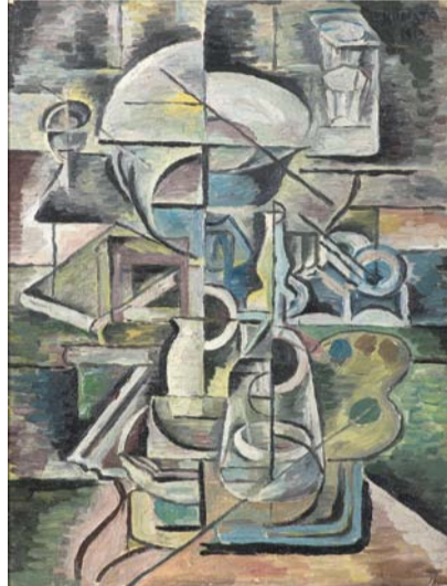
KUBIŠTA BOHUMIL, Zátíší malířské, olej na plátně, 47 x 34,8 cm, Vyvolávací cena, 29.000.000 Kč

Všechna tato díla budou k vidění na předaukční výstavě v ikonických prostorách naší výstavní síně Expo 58 ART (Letenské sady 1500/810, Praha 7) od 8. října do 8. listopadu 2025. Dne 9. listopadu pak bude od 16.00 hodin zahájena samotná aukce uměleckých děl.