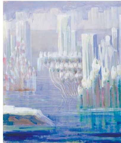
zdroj: © Národní muzeum výtvarného umění M. K. Čiurlionise

Více o porovnání symbolismu v české hudbě s pracemi Mikalojuse Konstantinase Čiurlionise se dozvíte v rámci výstavy