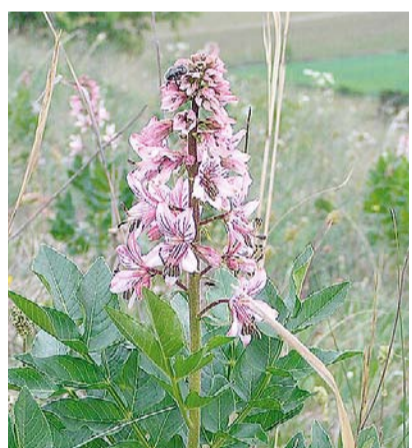
Třemdava bílá

Trasa je nenáročná a vede mezi malebnými vápencovými lomy, romantickými jezírky a unikátními skalními útvary. Výlet začíná na vlakové zastávce Hlubočepy, kam se snadno dostanete přímým vlakem ze Smíchova. Hned v úvodu vás čeká zastávka u Prokopského jezírka, vzniklého zatopením bývalého lomu. Dále vás cesta povede Prokopským údolím, na jehož svazích roste mnoho chráněných druhů rostlin. Jedním z nejzajímavějších je třemdava bílá. Tato pozoruhodná rostlina, patřící do stejné čeledi jako citrusy, vytváří při květu charakteristickou nakysle sladkou citronovou vůni. Lidový název „ohnivý keř“ navíc naznačuje další unikátní vlastnost třemdavy – z kvetoucích rostlin se odpařují von-