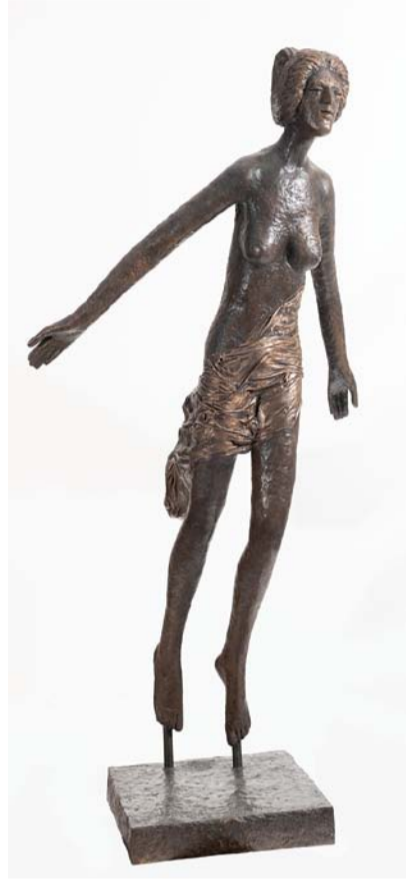
ZOUBEK OLBRAM, Múza (Múza pro Jihlavu), bronz, výška: 208,5 cm, vyvolávací cena: 1.500.000 Kč

Naše aukční síň Adolf Loos Apartment and Gallery je držitelem celé řady českých i světových aukčních rekordů. Minulý rok jsme například vydražili výjimečný obraz od Františka Kupky Conception / Danae (Početí) za úctyhodných 126,5 milionů korun. Stal se tak nejen nejdražším obrazem prodaným na aukci v České republice, ale také osobním rekordem samotného malíře.