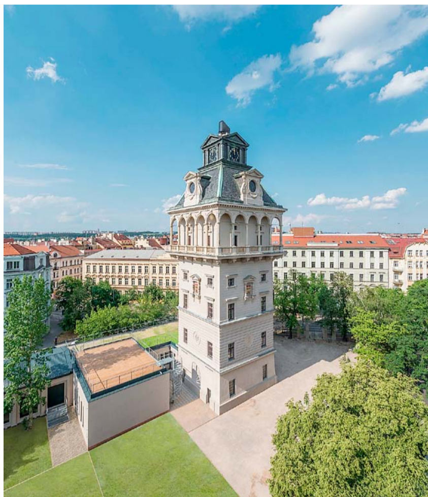
Vodárenská věž Letná, vycházka 2. 10.

▲11. 10. sobota Slavné vily nad Klamovkou a osada Budánka Z výpravné čtvrti do