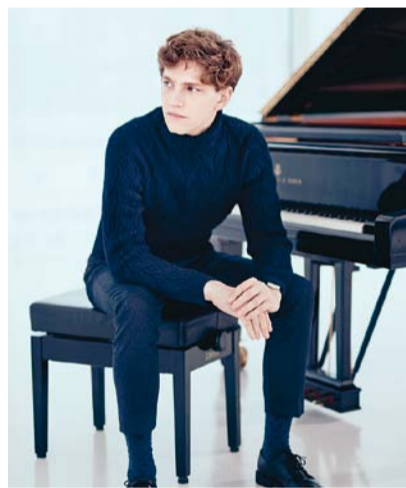
Jan Lisiecki

V Rudolfinu se uskuteční od 8. do 13. 11. pod hlavičkou Pražského jara již po třinácté Klavírní festival Rudolfa Firkušného, který ve čtyřech večerech opět nabídne špičku světového klavírního umění.