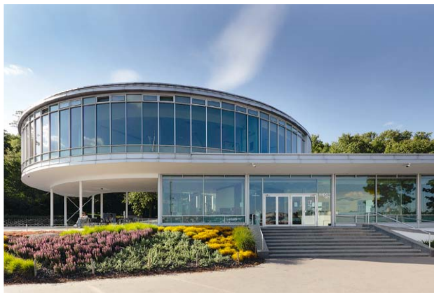
Výstavní síň Adolf Loos Apartment and Gallery se nachází v ikonickém bruselském pavilonu EXPO 58 v Letenských sadech v Praze.