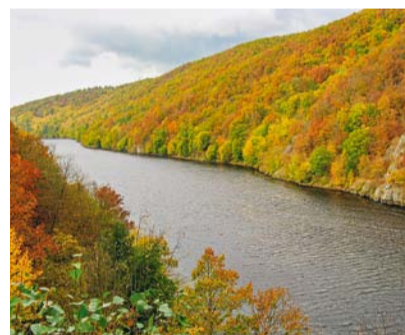
Pohled na Vltavu u bývalých Svatojánských proudů

Cílem výletu je legendární trampská osada Ztracená naděje, známá také jako Ztracenka, založená roku 1919 nad tehdejšími Svatojánskými proudy. Byla symbolem svobody, přátelství a života v přírodě. Její zakladatelé, mezi nimi i textař Jarka Mottl, zde vytvořili komunitu, která položila základy českého trampingu. Z původních chat se kvůli přehradě zchoval jen tůň s kovovými lipovými listy, připomínající zesulé osadníky.