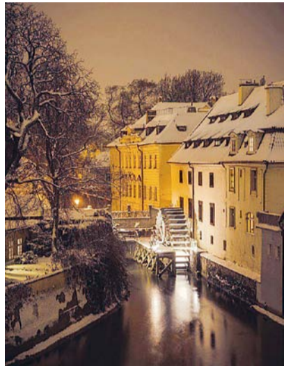
Tajuplná cesta Kampou, vycházka 1. 12.

On-line přednáška: Kolowratové O bohaté historii rodu, který po staletí spoluvytvářel dějiny českých zemí – od středověkých rytířů přes barokní mecenáše až po moderní osobnosti. Začátek v 17.30, průvodce H. Valentová.