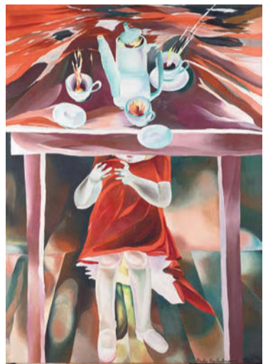
Eva Švankmajerová, Přesíla 1987

ševní činnosti u mužských, co mě obklopovali. Tedy, skoro u všech mužských“.