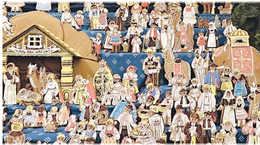
Perníkový betlém v kostele sv. Matěje, vycházka 28. 12.