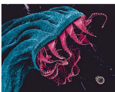
Vítězný snímek hlavní kategorie s názvem Anglermoss

Vítězem hlavní kategorie Vědy fotogenické se letos stal snímek Anglermoss od Tomáše Figury z Botanického ústavu AV ČR. Autor zachytil roduzoměnu mechorostu – téma, který je kvůli své složitosti postřachem nejednoho studenta botaniky. Fotografie ukazuje štět s tobolkou mechu po uvolnění výtrusů. Obústí tobolky připomíná zuby hlubinného predátora, který se chystá ulovit svou kořist. Tou je na obrázku klíčící pyl slézu lesního, jenž se do záběru připlítl náhodou. Výstavu Věda fotogenická 2025 můžete navštívit do 30. ledna 2026 v Galerii Věda a umění v hlavní budově Akademie věd ČR, Národní 3, Praha. Otevřená je každý všední den od 10 do 18 hodin a vstup je zdarma.