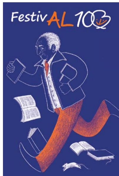
ilustrace: Apu Littera

Symbolická bude především filmová projekce s besedou se studenty situovaná do Památníku konference ve Wannsee v Berlíně, kde byla v roce 1942 koordinována nejvyššími představiteli tehdejší Říše otáz-