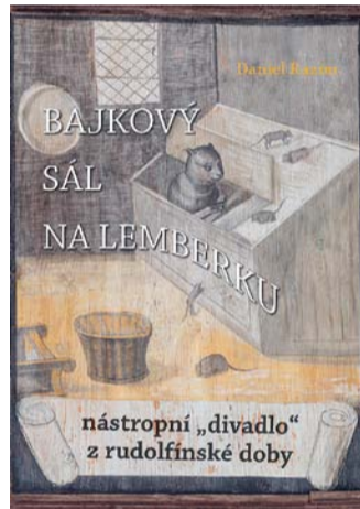
nástrojný „divadlo“ z rudolfínské doby