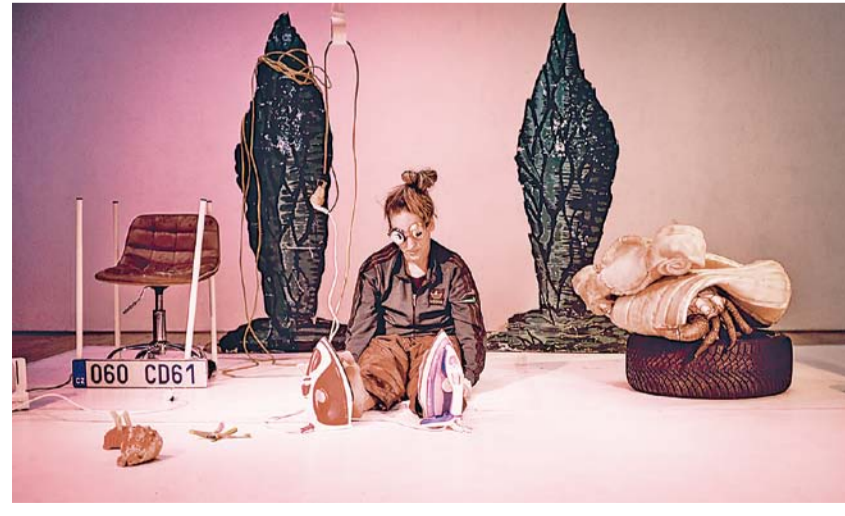
Ghost Compost Jsme, Chobotnice

ko, LGBT+, zapojení mladých do kulturních akcí, a v olympijském roce také sport. Bohatý divadelní program tradičně doplní diskuse, networking, procházky, herny pro děti i workshopy pro divadelní profesioná-