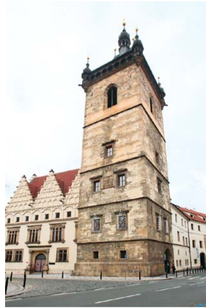
Novoměstská radnice

Pátý ročník festivalu zaměřeného na exkluzivní rukodělná šampaňská vína přijdou vinaři, kteří se momentálně řadí mezi vyhledávané výrobce champagne.