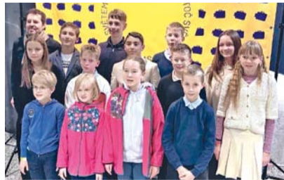
Freedom Frame Films

Film měl slavnostní premiéru na 57. ročníku filmového a televizního festivalu Oty Hofmana v Ostrově na Karlovarsku. Následně získal tři tuzemská ocenění na festivalech v Brně, Pardubicích a Praze. Následovaly festivalové úspěchy v zahraničí a nebylo jich málo. Na festivalu MOOKHO v Indii získal film tři hlavní ceny a stejný úspěch měl snímek na