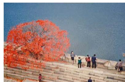
Petr Geisler: Červený strom, 1987, Japonsko

Geislerovo umění kaligrafie, jeho styl a umělecká kvalita byly oceňovány i japonskými znalci. Jeho výtvarné dílo bylo představeno na samostatných výstavách v Česku a na Slovensku a nachází se také ve sbírce Národní galerie Praha. Svými kaligrafiemi doprovodil rovněž několik významných publikací, např. Pár much a já: malý výběr z japonských haiku (1996), Zlatý pavilon (1998) nebo Cesta srdce (2008).