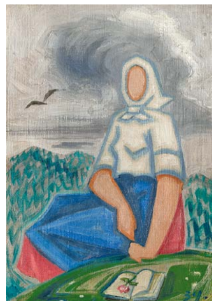
Josef Čapek, Touha, olej na jutovém plátně

Aukční katalog a více info na www.aloos.cz –PR–