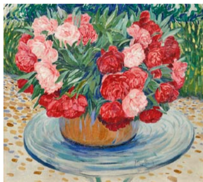
František Kupka, Pivoňky (červené a růžové), olej na plátně

K nejvýznamnějším položkám jarní aukce se řadí olej mimořádných kvalit Františka Kupky Pivoňky (červené a růžové), ze sbírky továrníka Jindřicha Waldese a následně velvyslance Štefana Osuského. Dalšími nabízenými unikáty jsou díla Zdeňka Sýkory, Josefa Šímy, Josefa Čapka, Václava Bošáka, Emila Filly nebo Mikuláše Medka.