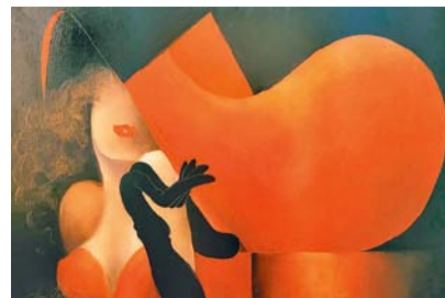
Elegance – výstava malíře Jana Rapina

Prohlídky s poutavým výkladem dopolední či při západu slunce v předem stanovených termínech. Nutná rezervace předem. Pro skupiny od 10 osob možný individuální termín.